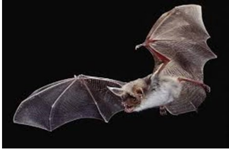
Murin de Bechstein (Bechsteinfledermaus) Grand Murin (Große Mausohrfledermaus)