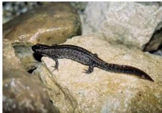
Triton crêté (Kamm-Molch)